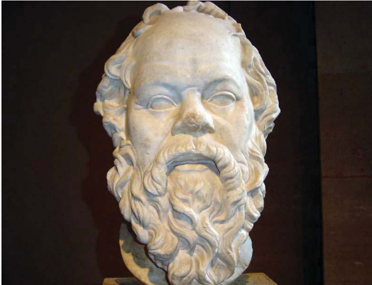
(085) Сократ. Копия работы Лисиппа. I в. н.э.

Сократ излагал свои взгляды только устно, они дошли до нас через свидетельства современников. Основными среди этих свидетельств являются сочинения его юных друзей и последователей Ксенофонта (прежде всего "Воспоминания о Сократе") и Платона. В случае последнего не всегда легко провести границу между взглядами Сократа и самого Платона. К сократическим обычно относят ранние диалоги Платона до "Протагора" включительно. Считается несомненным, что по крайней мере в "Апологии" и "Критоне" платоновский Сократ соответствует историческому оригиналу. Сократа-философа нельзя отделить от Сократа-человека, ибо мудрость знания состоит в мудрости жизни. Для него философия была адекватным способом человеческой жизни. Поэтому для понимания мировоззрения Сократа факты его биографии так же важны, как и его суждения.