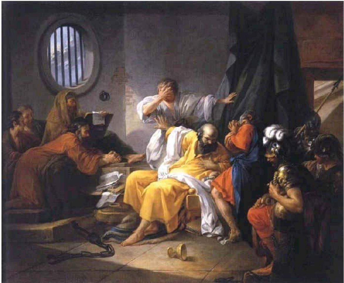
(089) Сен-Кантен Ж.-Ф.-Ж.. Смерть Сократа. 1762.

Смерть Сократа травмировала европейский дух. Она стала знаком беды. Мыслящие люди должны были задуматься: имеет ли право на существование строй жизни, отторгающий от себя праведность как чужеродный элемент? Что это за мир и люди, которые убивают Сократа? Первый и самый глубокий ответ на этот вопрос дал Платон. В.С. Соловьев в замечательном очерке «Жизнь и драма Платона» так раскрывает логику и интеллектуальный результат душевных переживаний Платона: мир, который казнит лучшего из людей и из-за того, что он лучший, не может считаться подлинным миром. Поэтому следует предположить, что существует другой, занебесный мир, который является царством добродетели и добродетельных людей. Как бы ни относиться к философским образам Платона, в одном он несомненно прав: строй жизни, враждебный добродетели, нацеленный на внешнее благополучие, власть и богатство, является деформированным; он подобен гнойной опухоли. Мы не знаем, был ли Сократ первым праведником, казненным за свою праведность. Но мы достоверно знаем, что он был не последним в этическом мартирологе. Давно нет Сократа. Давно нет афинского полиса. Но разделявший их конфликт остался, обретя новых носителей и новые, еще более острые и опасные формы – конфликт между цивилизацией и моралью.