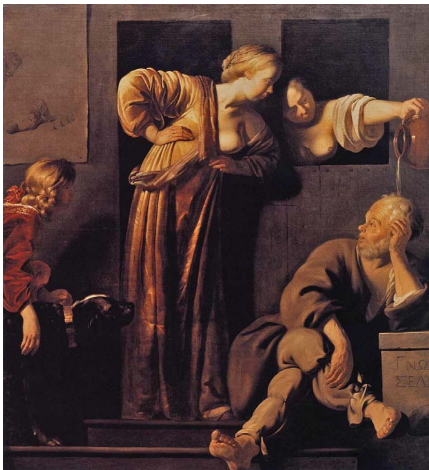
(086) Бломендаль Р. Ксантиппа, обливающая Сократа водой. Ок. 1655.

себя — с оводом, не дающим ему покоя. Сократ говорил, что его, видимо, бог приставил к афинянам, чтобы он, носясь повсюду, каждого из них "будил, уговаривал, укреплял непрестанно" (1, 100). Сократ видел себя, свое призвание в том, чтобы "рассуждать о нравственной философии по рынкам и мастерским", исследуя, по его словам, "что у тебя и худого и доброго в доме случилось" (Гомер) 17 . Он был готов к таким рассуждениям в любое время и с любым человеком.